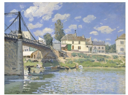
Alfred Sisley, Le Pont de Villeneuve la Garenne , 1872

Inspirés par les monuments anciens comme Renoir par le Pont-neuf , ils choisissent les grands boulevards parisiens et les nouveaux ponts routiers, ferroviaires édifiés le long de la Seine. Monet a peint à plusieurs reprises le pont d'Argenteuil , Sisley Le Pont de Villeneuve-la-Garenne .