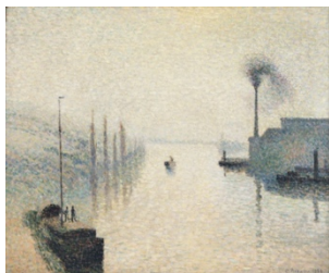
Camille Pissaro, Île Lacroix, Effet de brouillard , 1888

Durant l'hiver 1879 les températures dans la vallée de la Seine sont descendues à -22^{\circ} , le fleuve a gelé et une quantité de neige s'est accumulée à sa surface. Monet a réalisé une série de 17 vues du fleuve depuis la rive de Vétheuil montrant la Seine encombrée de glaces flottantes couvertes de neige. Dans chacune de ces toiles Monet a fait varier la qualité de la lumière hivernale, la perspective ou l'atmosphère.