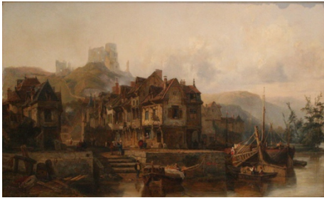
M.V.F. Danvin, Vue des bords de Seine, sous le Château-Gaillard, aux Andelys, lieu de naissance de Nicolas Poussin, 1834

Avant 1870, l'histoire de la représentation du travail sur les rives de la Seine s'inscrit dans la tradition des Vedute , une importance portée au détail. L'émergence d'une bourgeoisie aisée crée une demande de scènes dans le style hollandais qui représente la vie des marchands et qui devaient exprimer leur réussite.