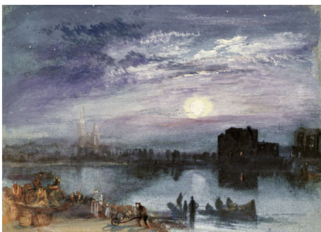
William Turner, Saint-Denis , 1833

Durant sa brève carrière, Bonington est l'un des artistes les plus admirés parmi les romantiques anglais pour avoir utilisé, dans ses paysages de la vallée de la Seine, les nouvelles techniques de l'aquarelle et de la lithographie. Corot dira d'un de ses paysages de la Seine : Cette petite peinture fut pour moi une révélation. Je découvris la sincérité devant la nature et de ce jour m'affermis dans ma résolution de devenir peintre.