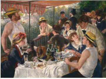
Auguste Renoir, Déjeuner des canotiers , 1880-1881

C'est à Chatou, à la Maison Fournaise , un restaurant sur les bords de Seine qu'Auguste Renoir 1841-1919 réunit ce groupe dont il émane une forte joie de vivre. Il a été dit de cette toile : Il y a une bonne humeur contagieuse dans son œuvre – une vitalité débordante qui croque à belles dents la vie moderne.