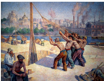
Maximilien Luce, Batteurs de pieux, quai de la Seine à Billancourt , 1903

l’ameublement. Les teintureries utilisaient l’eau de la Seine pour teindre les étoffes tissées avec le lin cultivé dans la région.