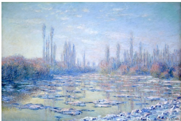
Claude Monet, les glaçons , 1880

Monet commente son œuvre ainsi : Le paysage n'est qu'une impression, et instantanée, d'où cette étiquette qu'on nous a donnée à cause de moi, du reste. J'avais envoyé une chose faite au Havre, de ma fenêtre ; du soleil dans la buée et, au premier plan, quelques mâts de navire pointant... On me demande le titre pour le catalogue, ça ne pouvait pas passer pour une vue du Havre. Je répondis : « Mettez impression ». On en fit impressionnisme et les plaisanteries s'épanouirent.