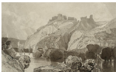
John Sell Cotman, Chateau-Gaillard , 1818 Gouache et aquarelle monochrome

John Sell Cotman 1782-1842 fait partie de la première vague d'artistes britanniques qui ont franchi la Manche après la bataille de Waterloo, dans le but de recueillir l'héritage normand de la Grande Bretagne.