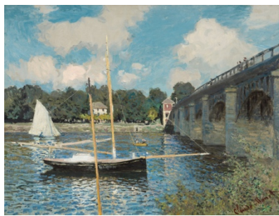
Claude Monet, Le pont routier, Argenteuil , 1874