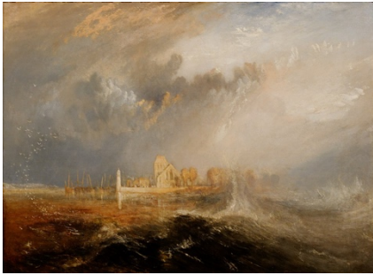
William Turner, Embouchure de Seine Quillebeuf , 1833

Presqu'un demi-siècle avant les impressionnistes, Turner peint les effets de la lumière, des nuages changeants, du brouillard et de la brume sur les bateaux, sur les villages, le long de la Seine.