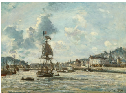
J.B. Jongkind, L'Entrée du port d'Honfleur, jour de vent, 1864

Toutefois les activités portuaires à Honfleur sont représentées par Johan-Bartold Jongkind 1819-1891 , au Havre par Eugène Boudin 1824-1898 , à Paris par Armand Guillaumin 1841-1927 .