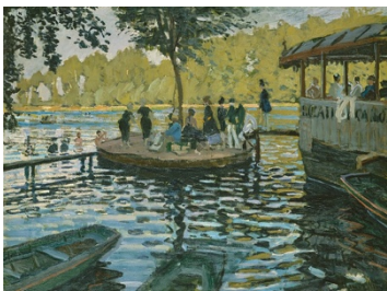
Claude Monet, Bain à la grenouillère , 1869

De son côté Eugène Boudin connaît un franc succès parce qu'il représente les vacances des parisiens dans les stations balnéaires de la Manche et célébraient ainsi implicitement l'entrée de la France dans la prospérité de l'ère industrielle.