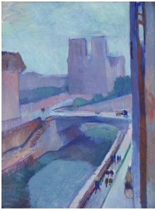
Henri Matisse, Vue de Notre-Dame dans l'après-midi , 1902

mystique se dégage de ce tableau. Tanner est le premier artiste noir américain à avoir acquis une réputation internationale au XX ème siècle.