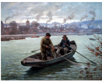
Emile Minet, Pêche à la violette devant Elbeuf , 1887

Au milieu des années 1880, les néo impressionnistes manifestent leur prédilection pour les scènes industrielles. On leur prête souvent des intentions politiques