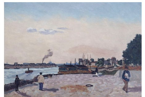
Armand Guillaumin, Le Quai de Bercy, 1874