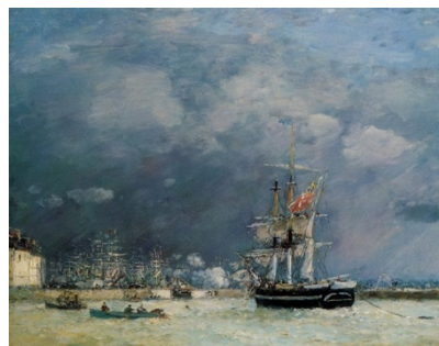
Eugène Boudin, Port du Havre, Le Soir, 1883