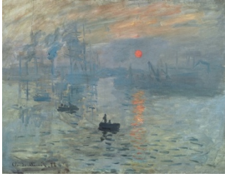
Claude Monet, Impression au soleil levant , 1873

Ce célèbre tableau représente le port du Havre peint d'une fenêtre d'hôtel. En se concentrant sur le lever du soleil, Monet transforme une scène industrielle en une scène contemplative. Sa palette : des gris pourpres et des oranges ; son trait : des verticales et des horizontales.