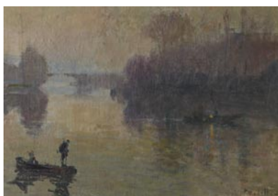
Joseph Delattre, L'Île Duboc , 1900

L'Île Duboc , située en amont de Rouen est le rendez-vous champêtre des peintres régionaux, ceux de l'École de Rouen , pendant des dizaines d'années avant et après 1900. Joseph Delattre 1858-1912 en est l'une des figures les plus importantes.