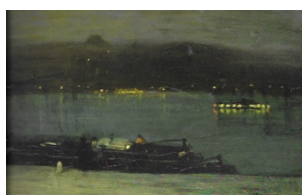
James Wilson Morrice, Effet de nuit sur la Seine , 1897-1898

Dans ce tableau, Charles Angrand 1854-1926 , réalise se tableau avec une composition et une palette réduite. La lumière diffuse produit un effet poétique renforcé par la silhouette solitaire du pêcheur dans son petit bateau.