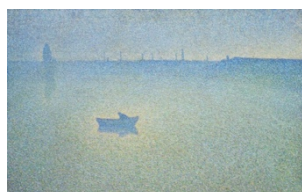
Charles Angrand, La Seine à l'aube , 1889

Pour ce tableau, Île Lacroix, Effet de brouillard , le choix d'un motif voilé par le brouillard permet à Camille Pissaro 1830-1903 de se focaliser sur le jeu des couleurs, d'adoucir des formes agressives et brutales, d'estomper les détails peu esthétiques.