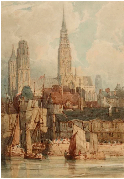
Richard Parkes Bonington, Cathédrale de Rouen et ses quais , 1822

aquarelles dont celle-ci afin de les utiliser pour réaliser des gravures qu'il inclura dans son ouvrage Antiquité architecturales de Normandie .