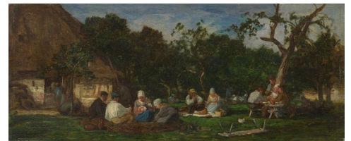
Eugène Boudin, La Ferme de Saint-Siméon, Les gens à table , 1855-1857