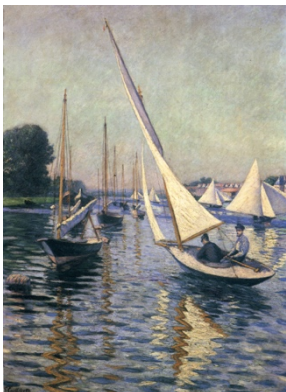
Gustave Caillebotte, Régate à Argenteuil , 1893

Dans son tableau Un dimanche à la Grande jatte , 40 personnages statiques, étranges, figés dans des attitudes de marionnettes, représentent diverses catégories sociales. Un petit monde qui occupe l'espace qui lui est assigné. Sur le fleuve, des bateaux à voile, des vapeurs, des canoës de compétition, un bac.