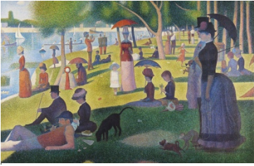
Georges Seurat, Un dimanche après-midi à la Grande jatte , 1886

C'est à Chatou, à la Maison Fournaise , un restaurant sur les bords de Seine qu'Auguste Renoir 1841-1919 réunit ce groupe dont il émane une forte joie de vivre. Il a été dit de cette toile : Il y a une bonne humeur contagieuse dans son œuvre – une vitalité débordante qui croque à belles dents la vie moderne.