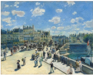
Auguste Renoir, Le Pont-Neuf , 1872

Les impressionnistes sont le premier groupe d'avant-garde à peindre la vie citadine moderne, déterminés à représenter à la fois l'haussmannisation de Paris et la vallée de la Seine avec les transformations liées à l'entrée de la France dans l'ère industrielle.