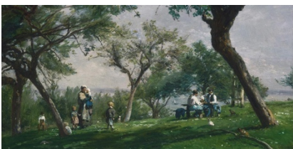
Félix-Adolphe Cals, Paysage avec personnage - La Ferme Saint-Siméon , 1876

Les paysagistes romantiques français vont introduire la peinture de scène de nature dans la vallée de la Seine où ils vont trouver leurs sujets favoris : couchers de soleil, vues grandioses, effets atmosphériques dramatiques