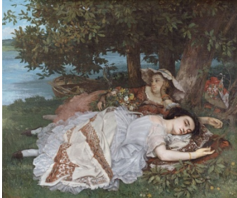
Gustave Courbet, Les demoiselles des bords de Seine , 1856

Le thème des loisirs n'est apparu que lorsque les activités de détente jusque-là réservées à une minorité de privilégiés sont devenues accessibles grâce aux progrès technologiques et à la prospérité économique du 2 nd Empire et de la III ème République.